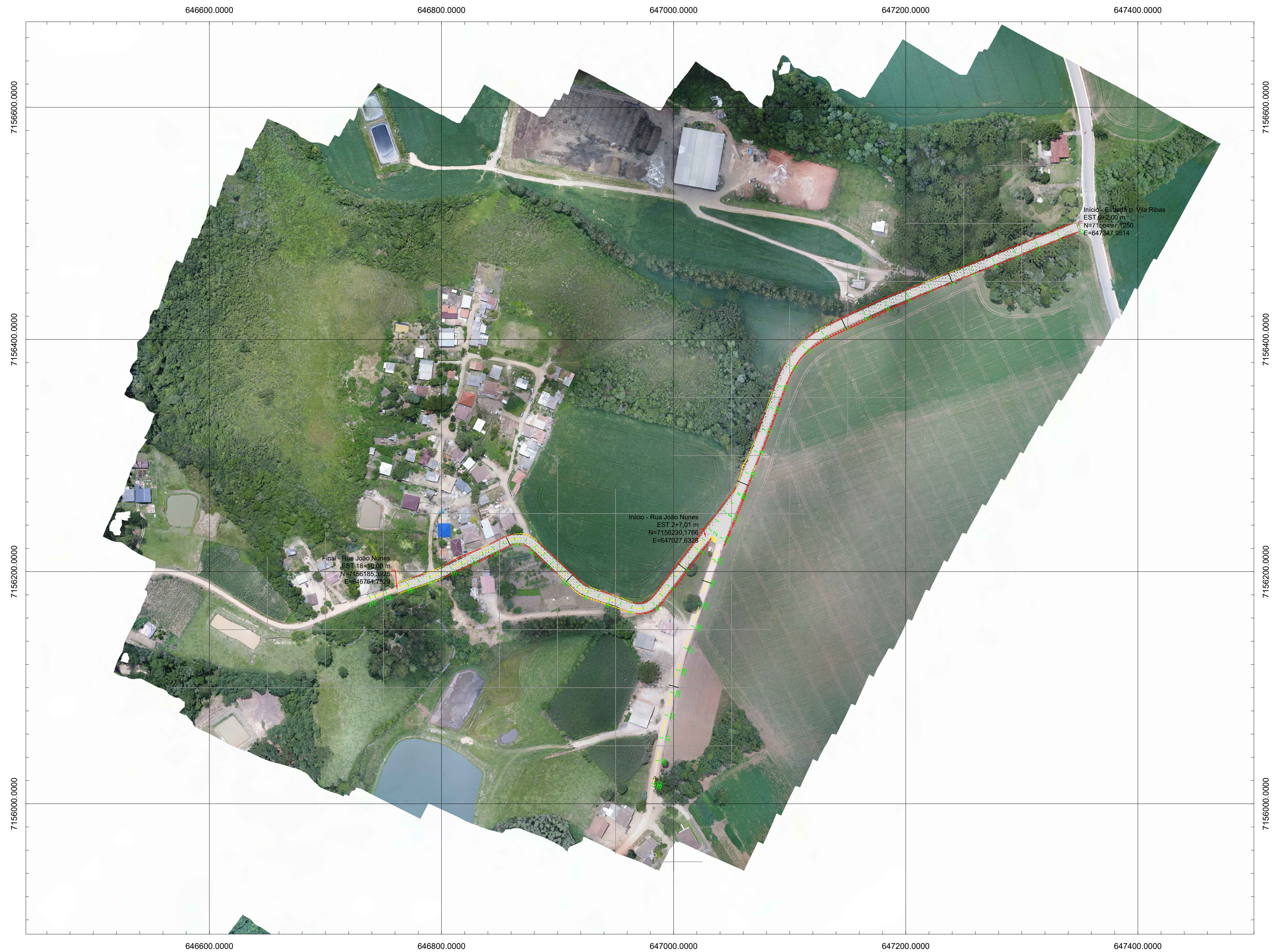
LOCALIZAÇÃO ESCALA 1:2000